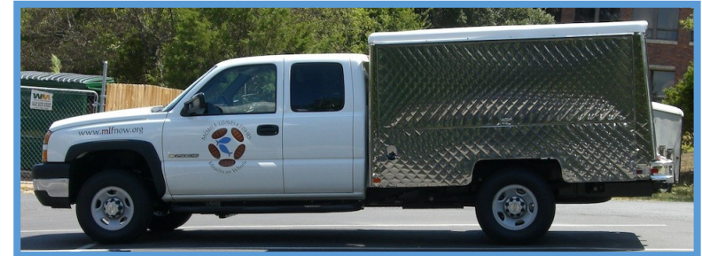
Mobile Loaves and Fishes: comida gratis y ropa gratis.

Biblioteca móvil: Obtener una tarjeta de la biblioteca, tomar prestados libros y películas, y utilizar una estación de trabajo de computadora y impresora.